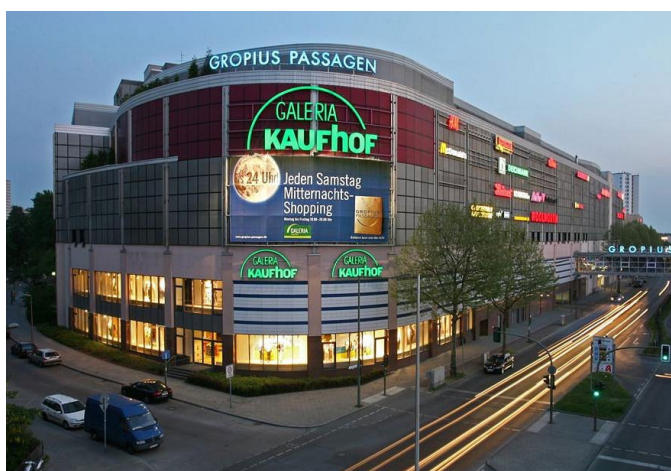
Berlins größtes Einkaufszentrum ist ca. 15 Min. Fußweg / 5 Min. Autofahrt entfernt. Berlin's largest shopping center is about 15 minutes walk / 5 minutes drive away.